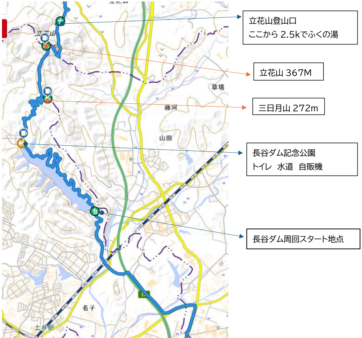
<コース図 2> 長谷ダム～長谷ダム記念公園～三日月山～立花山登山口(8.4k～16k)