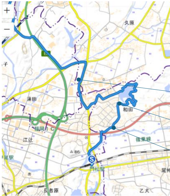
<コース図1> 門松駅から東部清掃工場 0k~7k